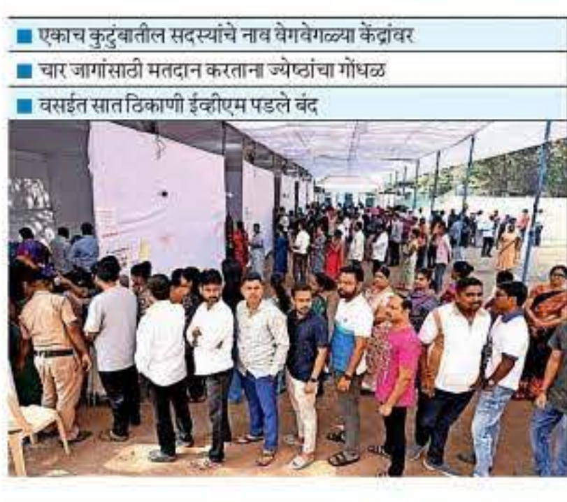
एकाच कुटुंबातील सदस्यांचे नाव वेगवेगळ्या केंद्रांवर / चार जागांसाठी मतदान करताना ज्येष्ठांचा गोधळ / वसईत सात ठिकाणी ईवीएम पडले बंद

टीम मटा, नवी मुंबई / पनवेल / वसई / मिराभाईदर / उल्हासनगर / भिवंदी नवी मुंबई महानगरपालिकेच्या १११ जागांसाठीची मतदान प्रक्रिया, तुरळक घटना वगळता, गुरुवारी शांततेत पार पडली. त्यात ४९९ उमेदवारांचे भवितव्य मतपेटेत बंद झाले आहे. तब्बल दहा वर्षांनी होणाऱ्या या निवडणुकीच्या मतदानासाठी मतदारांमध्ये कमालीचा उत्साह होता. त्यामुळे सर्व मतदान केंद्रांवर मतदारांची गर्दी वाहायला मिळाली. मात्र, मतदारयाद्यांमधील घोळ कायम असल्याने, अनेक मतदारांना आपली नावे शोधण्यासाठी धावाधाव करावी लागली. वनमंत्री गणेश नाईक यांनाही याचा फटका बसला. अनेक मतदारांनी धावाधाव करून मतदान केंद्र शोधून आपला मतदानाचा हक्क बजावला. नवी मुंबईची महापालिका निवडणूक तब्बल दहा वर्षांनी होत