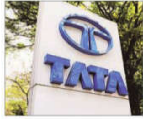
The Tata Sons listing question has emerged as a major point of disagreement among trustees

Tata Sons had sought to surrender its core investment company registration to escape the requirement. However, the RBI's latest clarifications on indirect access to public funds, coupled