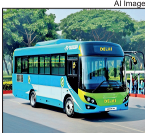
सवारियों के उतरने के कुछ दूर जाने के बाद कंडक्टर ने एक सवारी के सीट के नीचे कागज में लिपटा हुआ कुछ सामान देखा। बम की आशंका को देखते ही तुरंत चालक ने बस को साइड में लाकर उमसें सवार सभी को सुरक्षित बस से उतार कर पुलिस को घटना की जानकारी दे दी।

■ विस, राणहौला : राणहौला इलाके के चंचल पार्क में शनिवार रात एक क्लस्टर बस में बम होने की सूचना से हड़कंप मच गया। बस कंडक्टर ने बस में संदिग्ध वस्तु देखकर सवारियों को बस से उतार कर पुलिस को इसकी सूचना दी। बम निरोधक दस्ता और एनएसजी की टीम ने उम्रिध वस्तु को जांच की। लेकिन संदिग्ध कोई विस्फोटक नहीं मिला। जांच करने पर पता चला कि संदिग्ध चीज मोटर पार्ट्स थी, जिसे बस सवार गलती से छोड़कर चला गया था। पुलिस ने बताया कि शनिवार रात 9.53 बजे एक क्लस्टर बस के कंडक्टर ने बस में बम होने की सूचना दी। पुलिस को बताया कि वह रूट नंबर 961 की बस को नांगलोई से लेकर चला था। चंचल पार्क से पहले कुछ सवारी बस से उतरती।