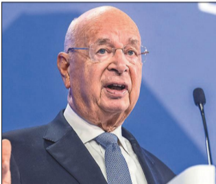
Schwab started in 1971 what later became the World Economic Forum as a management symposium

Geneva: The founder of the World Economic Forum Klaus Schwab has stepped down from the organization's board of directors after more than 50 years at the helm. He will be succeeded on an interim basis by the WEF's vice chairman Peter Brabeck-Letmathe, the former CEO and chairman of Nestlé SA, according to a statement by the forum. "I have decided to step down from the position of Chair and as a member of the Board of Trustees, with immediate effect," Schwab said in the statement. The forum has begun a search process for a future chair. WEF STARTED IN 1971 The WEF, hosted once a year in the Swiss ski-town of Davos, is one of the world's most-exclusive gatherings of head of states, top politicians, executives and business leaders. Schwab started what became the WEF in 1971 as a