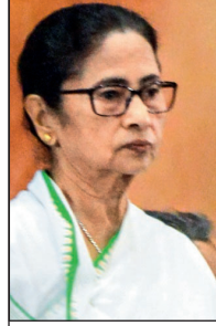
पश्चिम बंगाल की CM ममता बनर्जी।

भाषा, नई दिल्ली : बीजेपी ने पश्चिम बंगाल की मुख्यमंत्री ममता बनर्जी पर सोमवार को आरोप लगाया कि उन्होंने मुर्शिदाबाद के हिंसा प्रभावित इलाकों का अभी तक दौरा नहीं किया है, क्योंकि वह हिंदुओं से नफरत करती हैं।