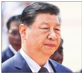
President Xi Jinping called on trading partners last week to oppose unilateral bullying Reuters

'Countermeasures' threatened amid Washington pressure on trading partners