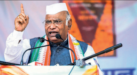
कांग्रेस अध्यक्ष मल्लिकार्जुन खरगे

पाटी अध्यक्ष देशभर का करेगे दौरा, भरगे नेताओं और कार्यकर्ताओं में जोश।