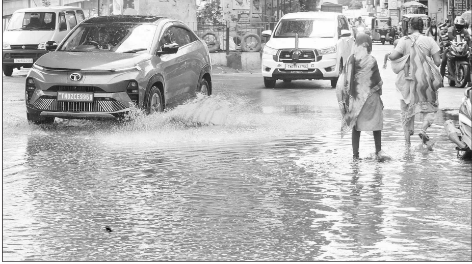
சென்னையில் இன்று அதிகாலையில் பலத்த மழை பெய்தது. இதனால் அண்ணா ஆர் பகுதி, பூந்தமல்லி சாலைகளில் தண்ணீர் பெருக்கெடுத்து ஓடியது.