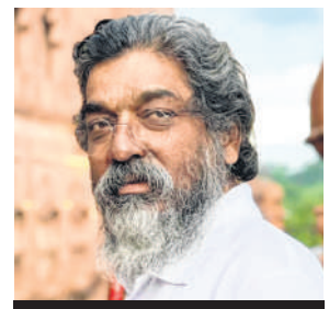
NITIN DESAI SUICIDE

The company shared details of the financial transactions executed with