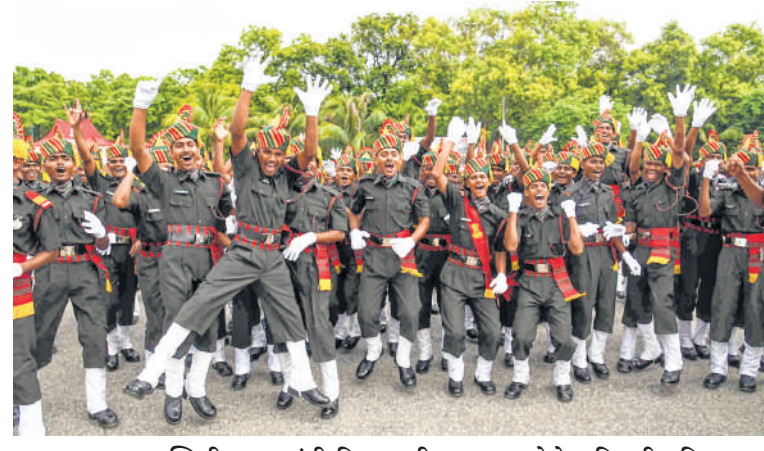
लष्कराच्या अग्निवीर जवानांनी बिहारमधील पाटणा येथे शनिवारी प्रशिक्षण यशस्वीरित्या पूर्ण केल्यावर आनंद व्यक्त केला.

आपण या अग्निपरीक्षेतून नक्कीच बाहेर पडू, असे वाघेला यांनी म्हटले आहे. प्रदेशाध्यक्ष चंद्रकांत पाटील यांच्यानंतर वाघेला गुजरात भाजपमध्ये सर्वाधिक ताकदवान मानले जात होते. भविष्यात भाजप प्रदेशाध्यक्ष बदलाची शक्यता वर्तवली जात होती, तेव्हा प्रदीपसिंह वाघेला यांच्या नावाची चर्चा होती. वाघेला यांच्या राजीनाम्यानंतर येत्या १० दिवसांत गुजरात भाजपमध्येही मोठे बदल होऊ शकतात, असे मानले जात आहे.