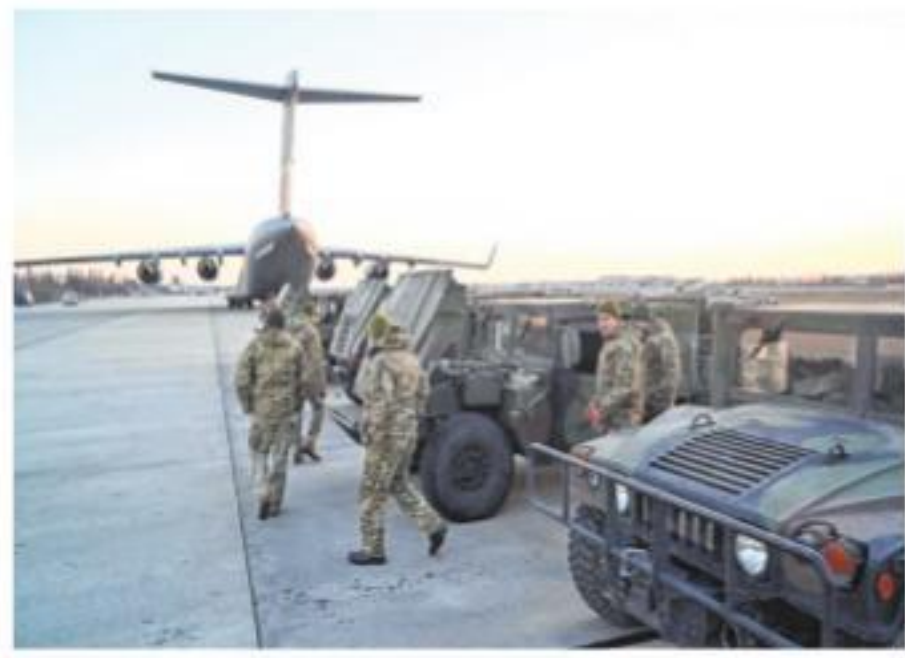
Servicemen of Ukrainian Military Forces examine the High Mobility Multipurpose Wheeled Vehicle (HMMWV) military trucks shipped from Lithuania to Boryspil airport in Kyiv on Sunday. —AFP

cation were underway on Sunday with the help of video footage. A mob stoned a middle-aged man to death in a village of Khanewal district on Saturday.