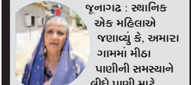
જૂનાગઢ : સ્થાનિક એક મહિલાએ જણાવ્યું કે, અમારા ગામમાં મીઠા પાણીની સમસ્યાને લીધે પાણી માટે ગામની મહિલાઓને પાણી ભરવા છેક વાડી વિસ્તારમાં જવું પડે છે. અમારા વાસમાં પાણીનો વાડો છે. પરંતુ તેમાં પાણી નથી. અમે માલધારીઓ હવે જાય તો ક્યાં જઈએ.