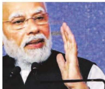
Prime Minister Narendra Modi speaks at the launch of India Int'l Bullion Exchange.

Policymakers are keen to have global financial services centres such as London and Singapore in Indian business hubs too. Modi told the gathering that the day was significant for India's growing economic