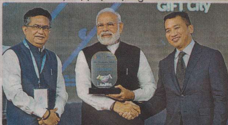
गिफ्ट सिटी में कार्यक्रम के दौरान प्रधानमंत्री नरेन्द्र मोदी।

इंटरनेशनल फाइनेंसियल सर्विस सेक्टर अथॉरिटी (आईएफएससीए) के मुख्यालय का शिलान्यास व एनएसई आईएफएससी-एसजीएक्स कनेक्ट को लॉन्च करते हुए उन्होंने कहा कि गुजरात में रहते हुए जब उन्होंने गिफ्ट सिटी की परिकल्पना की थी, तो वह सिर्फ व्यापार-कारोबार या आर्थिक गतिविधियों तक सीमित नहीं था। गिफ्ट सिटी देश के सामान्य लोगों की आकांक्षाएं जुड़ी हैं। गिफ्ट