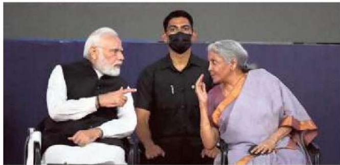
Grand launch: Narendra Modi with Nirmala Sitharaman during the foundation stone laying ceremony in Gandhinagar.

Moreover, setting up of IIBX could lead to standard gold pricing in the country and make it easier for small bullion dealers and jewellers to trade in the precious metal. India is a leading importer of the metal and imported 1,069 tonnes of gold in 2021, up from 430 tonnes a year ago. The yellow metal is tightly regulated in the country and currently only nominated banks and agencies approved by the Reserve