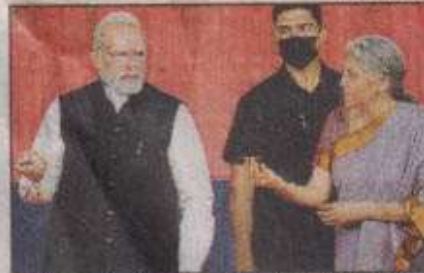
PM Narendra Modi and FM Nirmala Sitharaman inaugurate India's first international bullion exchange at GIFT City in Gandhinagar, on Friday

"India is now in line with countries such as the US, UK and Singapore which give di-