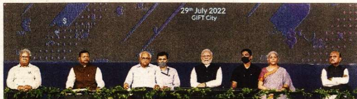
PM Narendra Modi with Union Finance Minister Nirmala Sitharaman, Gujarat CM Bhupendra Patel and other dignitaries at the foundation stone-laying ceremony of the IFSCA headquarters in Gandhinagar on Friday.

Foreign banks and institutions such as Deutsche Bank, Morgan Stanley Asia (Singapore) Securities OCBC Securities, Orient Fu-