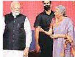
PM Narendra Modi with Finance Minister Nirmala Sitharaman in Gandhinagar on Friday.

Modi said he had conceived the idea of GIFT City as the chief