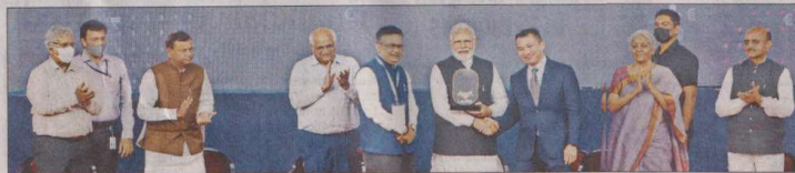
TIMES NEWS NETWORK

MOUs BETWEEN IFSCA AND FOUR FOREIGN REGULATORS: IFSCA signed MoUs with four foreign financial regulators namely the Monetary Authority of Singapore, Commission de Surveillance du Secteur Financier, Luxembourg; Qatar Financial Centre Authority and Finansinspektionen, Sweden. The MoUs will promote collaboration and partnerships between IFSCA and these regulatory authorities through exchange of best practices and capacity building.