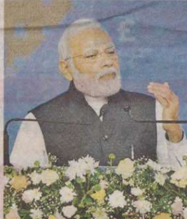
PM said that India's identity should not remain limited to just a big market, but it should be a 'market maker'

The Prime Minister said today India is one of the largest economies of the world. India International Bullion Exchange - IIBX, he said, is a crucial step in that direction. He mentioned the role of gold in ensuring economic empowerment of Indian