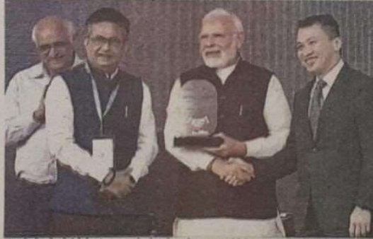
રહ્યા છે એમ તેમણે ઉમેર્યું હતું.

પરક્રમમાં વપતા વૈશ્વિક વિશાસ માટે પણ ખૂબ જ મહત્વપૂર્ણ છે. "આજે, ગિફ્ટ સિટીમાં, ઈન્ટરનેશનલ ફાઇનાન્સિયલ સર્વિસ સેન્ટર ઓથોરિટી - IFSCA હેઠળ ક્વોટર બિલ્ડિંગનો સિદ્ધાન્ત કરવામાં આવ્યો છે. હું માનું છું કે, આ ઈમારત તેના આર્કિટેક્ચરમાં જટલી બબ્બ છે, તે ભારતને આર્થિક મહાસત્તા બનાવવા માટે અમૂલ્ય તકો પણ ઊભી કરશે," એમ તેમણે કહ્યું. પ્રધાનમંત્રીએ જણાવ્યું હતું કે IFSC નવીનતાને પ્રોત્સાહન આપશે અને તે એક સમય તેમજ વૃદ્ધિ માટે ઉત્તેજક બનશે. આજે શરૂ કરાવેલી સંસ્થાઓ અને પ્લોટકોમાં ૧૩૦ કરોડ વ્યવસ્થાને આધુનિક વૈશ્વિક અર્થતંત્ર સાથે જોડવામાં મદદ કરશે. ભારત હવે બેંચસે, યુકે અને સિંગાપોર જેવા દેશોની લીગમાં પ્રવેશી રહ્યું છે જે વૈશ્વિક ફાઇનાન્સને દિશા આપી