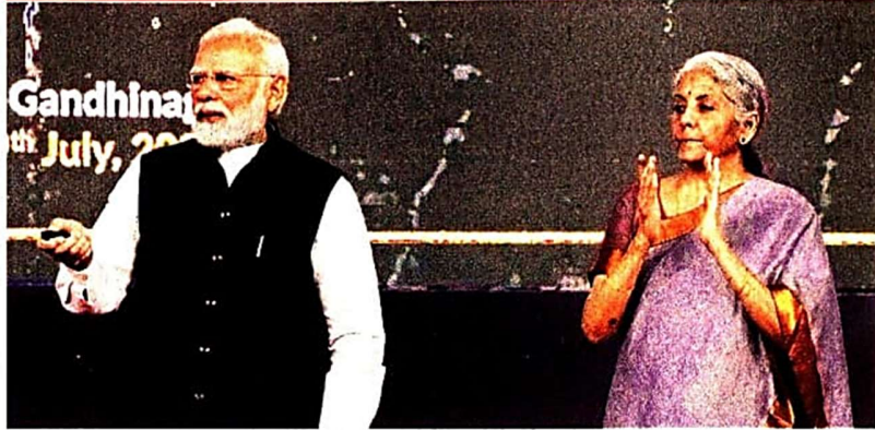
PM Narendra Modi launches dedicated local units of Deutsche Bank, JP Morgan and MUFG and a bullion exchange at GIFT City in Ahmedabad. Also seen is FM Nirmala Sitharaman