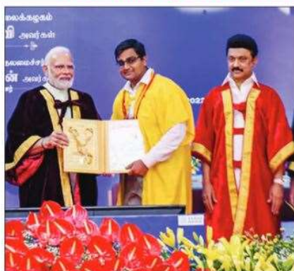
Prime Minister Narendra Modi handing over a degree certificate to a student during the 42nd Convocation of Anna University, in Chennai. Tamil Nadu Chief Minister M K Stalin is also seen

Modi said after independence India limited itself within its boundaries due to low self-confidence and "slavery" of hundreds of years, but now things are changing and the country is rapidly integrating itself with global markets. The Prime Minister was speaking at a function organized at the Gujarat International Finance Tec (GIFT) City near Gandhinagar after the laying foundation stone for the International Financial Services Centres Authority (IFSCA) and inaugurating the India International Bullion Exchange (IIBX) and NSC (National Stock Exchange) IFSC (International Financial Service Centre) and SGX (Singapore Exchange Ltd) Connect platform. Today, India is standing in line with countries like the USA, the UK and Singapore where new trends in the global financial sector are shaped. I congratulate