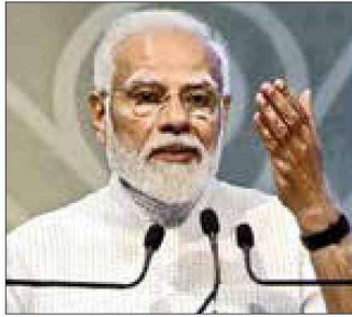
Prime Minister Narendra Modi

Modi was speaking at a function organized at the Gujarat International Finance Tec (GIFT) City near Gandhinagar after the laying foundation stone for the International Financial Services Centres Authority (IFSCA) and inaugurating the India International Bullion Exchange (IIBX) and NSC (National Stock Exchange) IFSC (International Financial Service Centre) and SGX (Singapore Exchange Ltd) Connect platform.