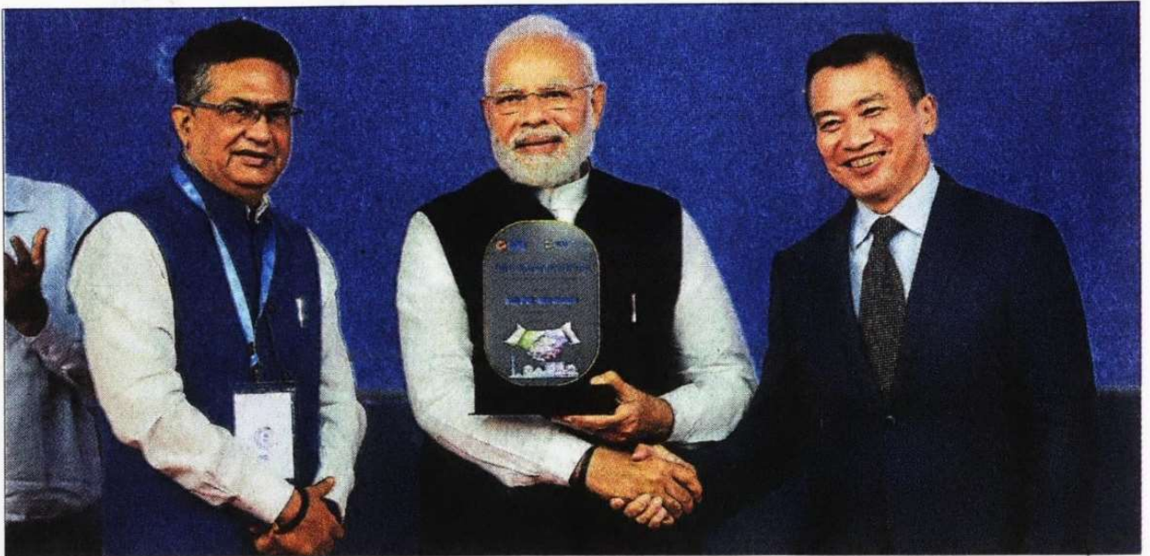
Prime Minister Narendra Modi with Singapore Exchange CEO Loh Boon Chye (right) and Indian National Stock Exchange MD and CEO Ashish Chauhan during the inauguration of the India International Bullion Exchange and the NSE IFSCSGX Connect at the GIFT City near Gandhinagar on Friday.