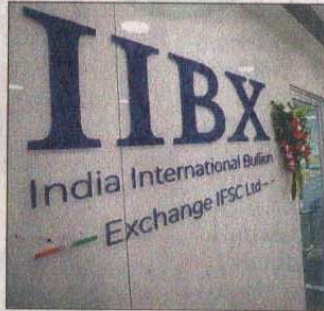
The India International Bullion Exchange at GIFT City in Gandhinagar on Friday.

"We would have better price negotiation strength with the launch of this bullion exchange," India's finance minister Nirmala Sitharaman said.