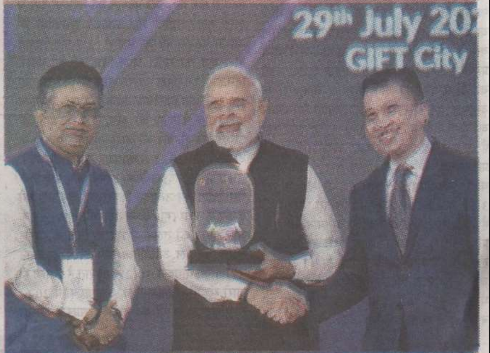
प्रधानमंत्री नरेंद्र मोदी गांधी नगर में आयोजित गुजरात इंटरनेशनल फाइनेंस टेक (गिफ्टी) सिटी में एक समारोह में भाग लेते हुए।

उन्होंने गुजरात इंटरनेशनल फाइनेंस टेक (गिफ्टी) सिटी में एक समारोह में यह भी कहा कि भारत दुनिया की अग्रणी अर्थव्यवस्थाओं में से एक है और उसे ऐसे संस्थानों का निर्माण करना चाहिए, जो इसकी वर्तमान और भविष्य की भूमिकाओं को निभा सकें। मोदी ने इससे पहले अंतरराष्ट्रीय वित्तीय सेवा केंद्र प्राधिकरण (आईएफएससीए) की आधारशिला रखी और इंडिया इंटरनेशनल बुलियन एक्सचेंज (आईआईबीसी) का उद्घाटन किया। इसके अलावा प्रधानमंत्री ने एनएससी (नेशनल स्टॉक एक्सचेंज) आईएफएससी (अंतरराष्ट्रीय वित्तीय सेवा केंद्र) और एसजीएक्स (सिंगापुर एक्सचेंज लिमिटेड) कनेक्ट मंच का उद्घाटन भी किया। मोदी ने कहा, भारत आज अमेरिका, ब्रिटेन और सिंगापुर जैसे देशों के साथ खड़ा है, जो वैश्विक वित्तीय क्षेत्र में नए रुझानों को आकार देते हैं। मैं इस उपलब्धि के लिए देश के लोगों को बधाई देता हूँ। उन्होंने कहा, भारत दुनिया की अग्रणी अर्थव्यवस्थाओं में से एक है और आगे