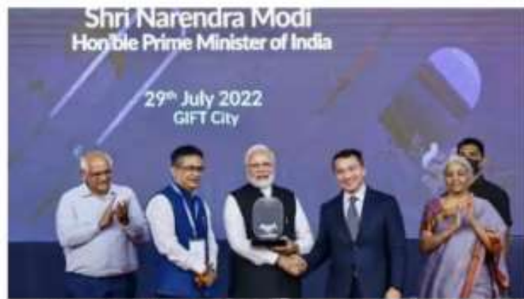
Photo Caption: Prime Minister Narendra Modi being felicitated by National Stock Exchange CEO Ashish Chauhan(L) during a ceremony for laying the foundation stone of IIFSCA Headquarters building, launch of India International Bullion Exchange and launch of NSE IFSC-SGX Connect, in Gandhinagar.