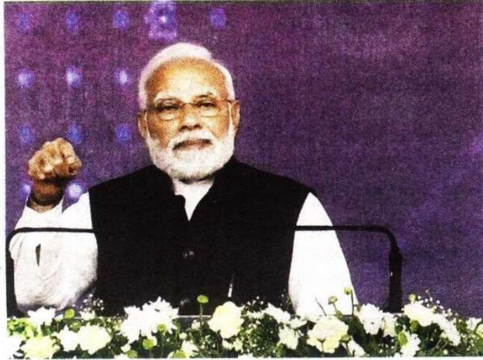
ગઈ કાલે ગિફ્ટ સિટીમાં ઇન્ટરનેશનલ ફાઇનેન્શિયલ સર્વિસિસ સેન્ટર ઓથોરિટીના મુખ્યાલયના શિલાન્યાસ દરમિયાન વડા પ્રધાન નરેન્દ્ર મોદી.

નરેન્દ્ર મોદીએ કહ્યું હતું કે 'મને વિશ્વાસ છે કે આ ભવન ભારતને આર્થિક મહાશક્તિ બનાવવા અસીમિત અવસર