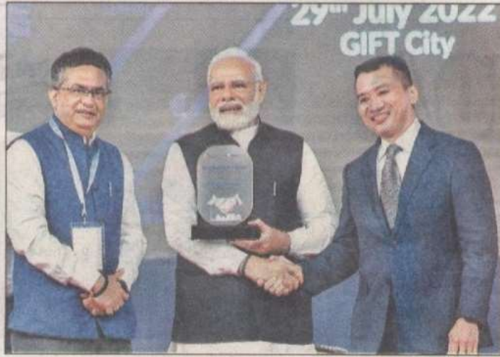
गांधीनगर : प्रधानमंत्री नरेंद्र मोदी को यहां आयोजित एक समारोह में मोमेंटो प्रदान किया गया।

गांधीनगर, 29 जुलाई (एजेंसी): प्रधानमंत्री नरेंद्र मोदी ने शुक्रवार को कहा कि भारत अब अमेरिका, ब्रिटेन और सिंगापुर जैसे चुनिंदा देशों की सूची में शामिल हो गया है, जो वैश्विक वित्तीय क्षेत्र में नए रुझानों को आकार देते हैं। उन्होंने कहा कि आजादी के बाद भारत ने आत्मविश्वास की कमी के चलते खुद को अपनी सीमाओं के भीतर सीमित कर लिया, लेकिन अब चीजें बदल रही हैं और देश तेजी से वैश्विक बाजारों के साथ खुद को एकीकृत कर रहा है। उन्होंने गुजरात इंटरनेशनल फाइनेंस टेक (गिफ्टी) सिटी में एक समारोह में यह भी कहा कि भारत दुनिया की अग्रणी अर्थव्यवस्थाओं में से एक है और उसे ऐसे संस्थानों का निर्माण करना चाहिए, जो इसकी वर्तमान और भविष्य की भूमिकाओं को निभा सकें। मोदी ने इससे पहले अंतरराष्ट्रीय वित्तीय सेवा केंद्र प्राधिकरण (आईएफएससीए) की आधारशिला रखी और इंडिया इंटरनेशनल बुलियन एक्सचेंज (आईआईबीसी) का उद्घाटन किया। इसके अलावा प्रधानमंत्री ने एनएससी (नेशनल स्टॉक