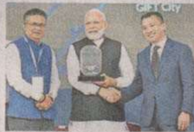
Prime Minister Narendra Modi during the event at GIFT City.

"The vision of the country's future is connected with GIFT City. It is also connected to the dreams of India's golden past... GIFT City was an idea ahead of its times," PM Modi said while ad-