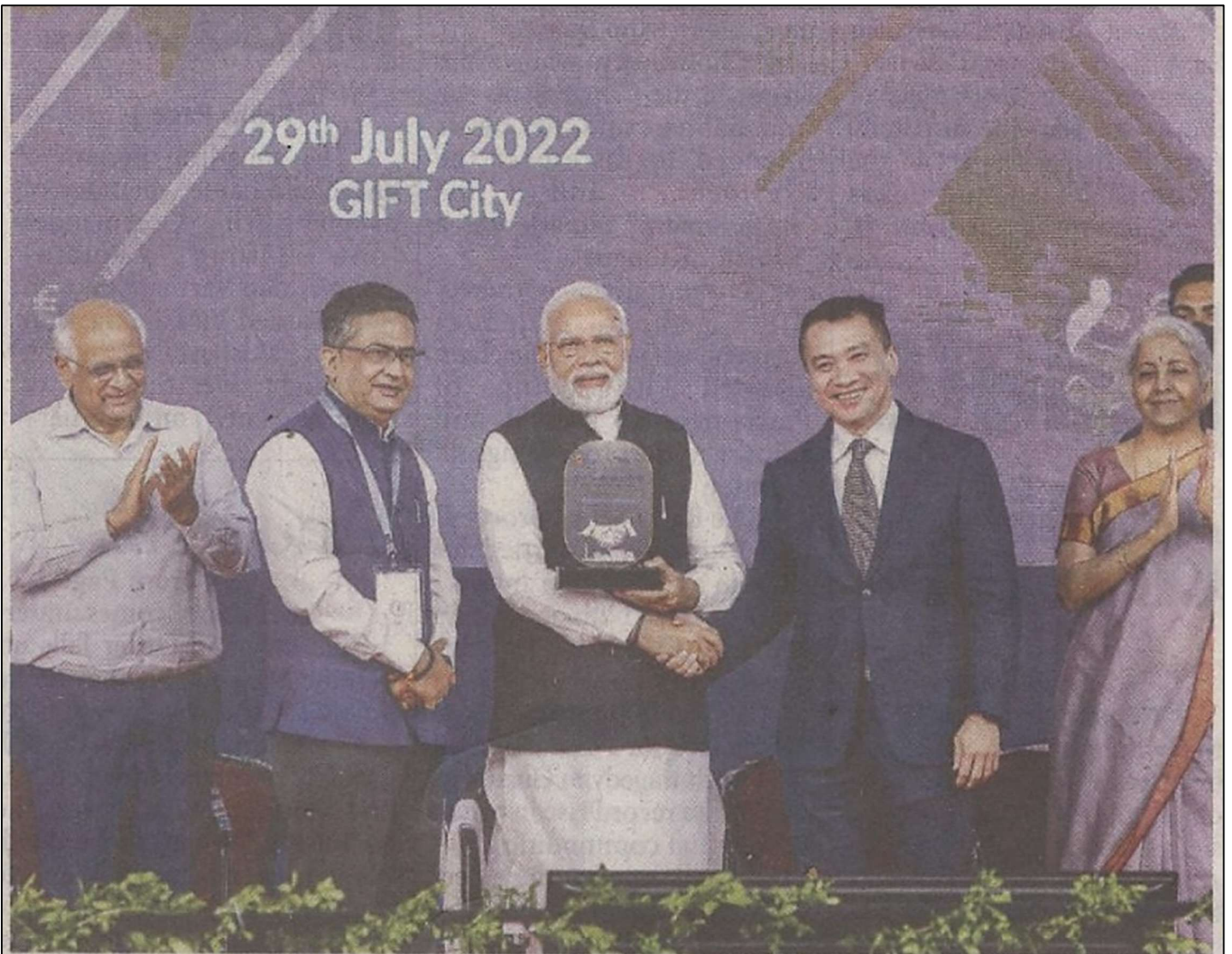
Prime Minister Narendra Modi being felicitated by National Stock Exchange CEO Ashish Chauhan (L) during a ceremony for laying the foundation stone of IIFSCA Headquarters building, launch of India International Bullion Exchange and launch of NSE IFSC-SGX Connect, in Gandhinagar on Friday. Union Finance Minister Nirmala Sitharaman and Gujarat CM Bhupendra Patel are also seen. "India is now in company of countries like the USA, UK and Singapore where new trends in the global financial sector are shaped," said Modi