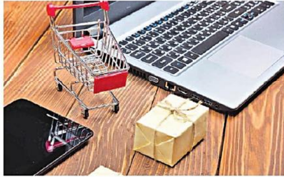
MARKETING HELP: Centre is eyeing Rs 10 lakh crore revenue in the next two to three years from Bharatcraft portal.

Speaking at 200th listing of an MSME company 'Wonder Fibromats' on NSE EMERGE, Gadkari said, "We want to give a boost to the MSME sector which is currently contributing nearly 29 per cent to the manufacturing segment and 40 per cent to the exports." The MSME sector has the potential to generate additional employ-